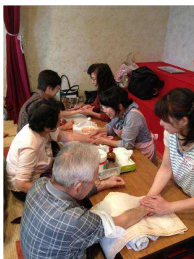
下:ハンドマッサージもありました

これ以外にもたくさんの交流会を開催しました！お伝えしきれないのが残念ですが、ふうあいねっとのブログに随時掲載しています！