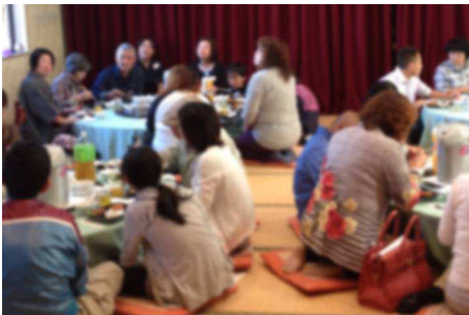
写真上:食事とおしゃべりを楽しむ参加者のみなさん