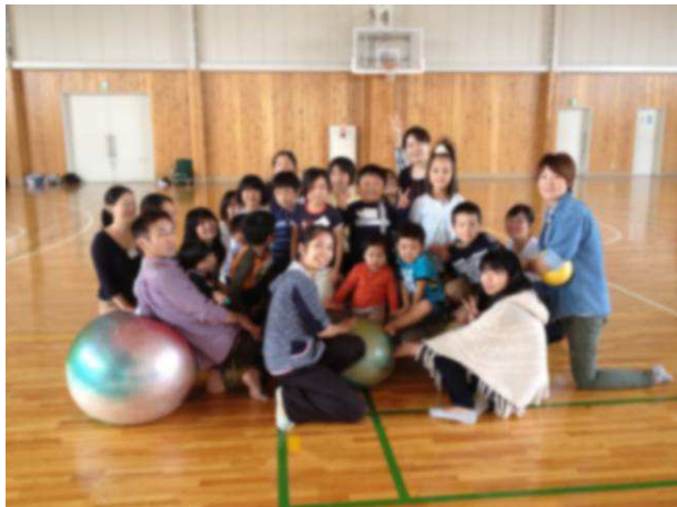
写真：Gボールを真ん中に集め、子どもたちはその上に乗っちゃいました♪

「Gボール」を使って親子で遊んだり、キッズだけでフリーマーケットでお買い物を楽しんだりしました。