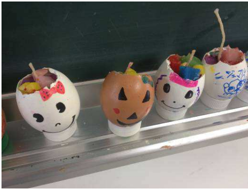
写真:かわいいエコキャンドルが作れました