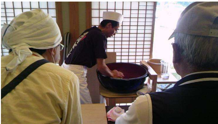
写真:手に力を込めて、そば打ち！