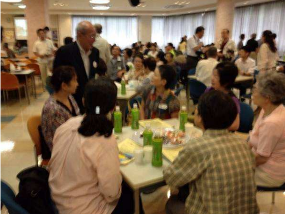
写真：参加者と歓談する馬場町長