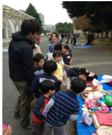
写真：茨城大学で開かれたフリーマーケットを楽しみむ子どもたち